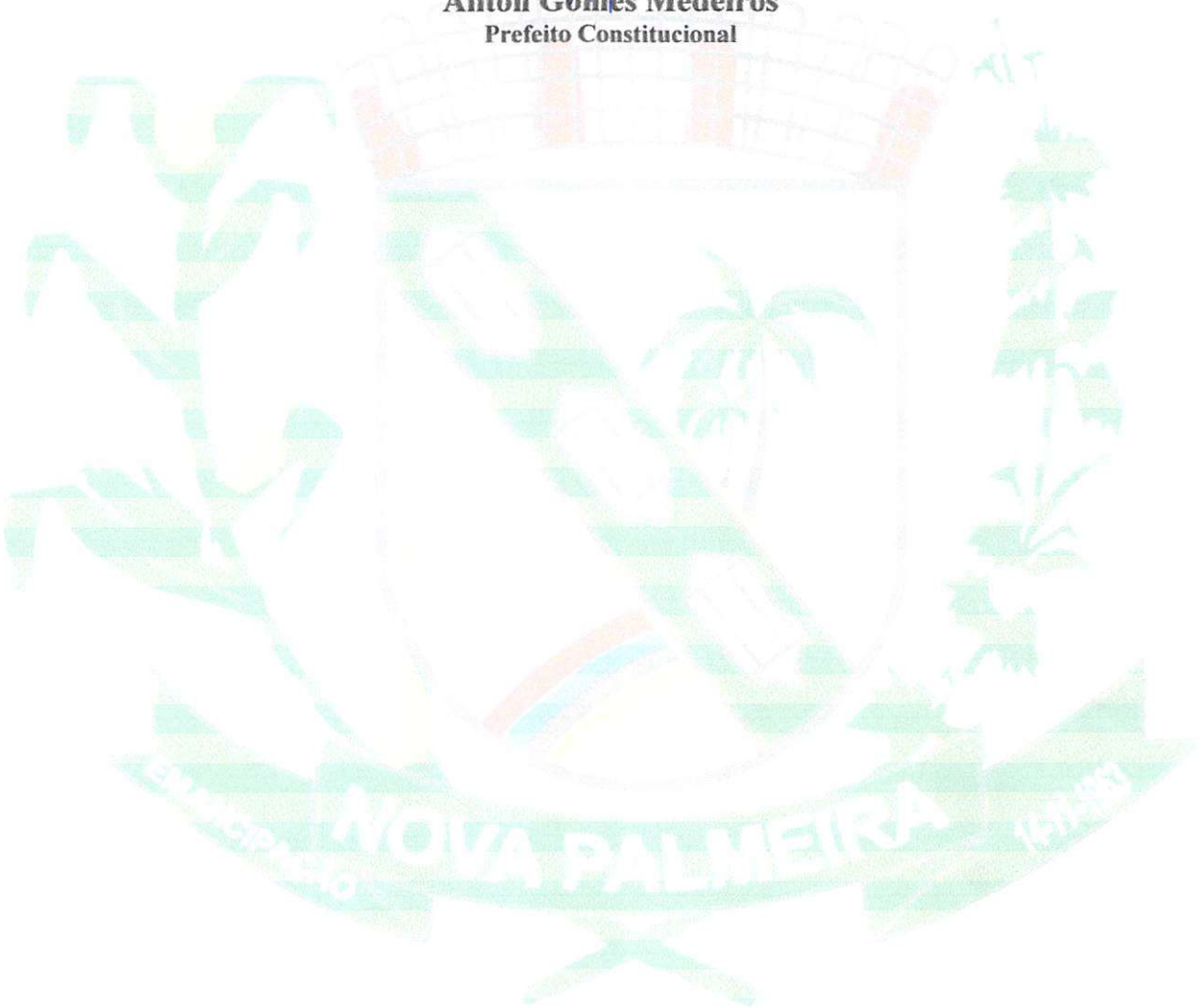
Ailton Gomes Medeiros Prefeito Constitucional